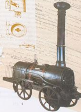
1. Портрет Е. Черепанова и М. Черепанова, изобретателей кузнечных молотов XIX в. 2. Чертеж парового двигателя Черепановых XIX в. 3. Чертеж парового двигателя Черепановых XIX в. 4. Модель парового двигателя Черепановых